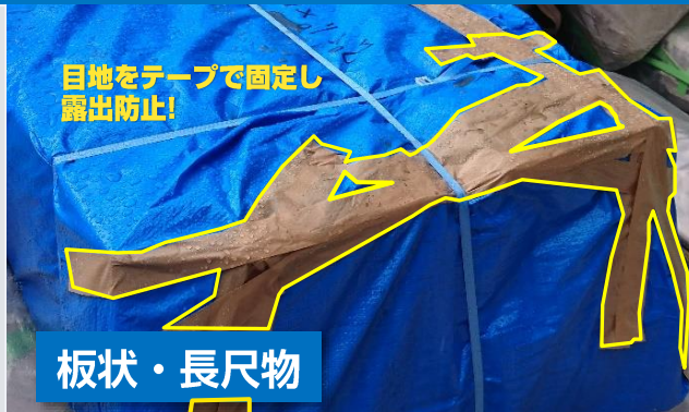
目地をテープで固定し露出防止!