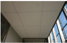
ケイ酸カルシウム板