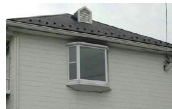
外壁仕上板材・サイディング

サイディングの外側、中に木や紙が付着している、 練り込んである場合は搬入不可 。また、サイディング以外でも安定型廃棄物以外の品目が 建材の一部となっている廃棄物は搬入不可