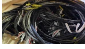
延焼防止材（石綿含有）