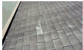
アスファルトフリンジ