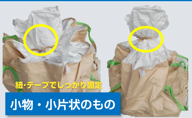
紐・テープでしっかり固定