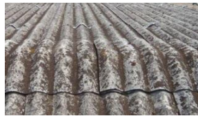
スレート板・波板