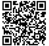
※国土交通省・経済産業省専用データベースサイト

右記は、国土交通省の、石綿含有建材のデータベースサイトです。石綿（アスベスト）の含有が不明なもの、または疑わしい場合には、予め、これらのサイトを利用して含有していないという証明資料等の根拠としてご活用されるとより適切な処分に繋がります。