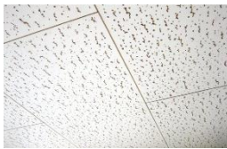
石膏ボード・ジプトン