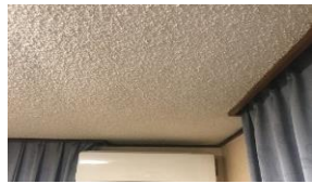
フレキシブル板・平板

弊社へ搬入ができる石綿含有産業廃棄物（レベル3）は次の通りです。排出の際は十分な強度がある袋（フレコン・石綿含有専用の透明袋等）で二重梱包にしたうえ、紐やテープ等で口を塞いで排出してください。※梱包例は本チラシ下部記載