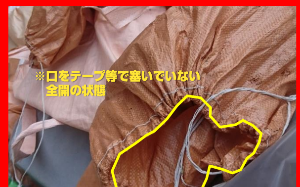
※口をテープ等で塞いでいない全開の状態

・土のう袋のみの梱包。 ・口をテープ等で塞いでいない。 →石綿が飛散する可能性が高い!